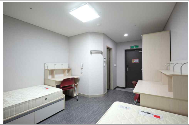
Dorm room with a built in bathroom