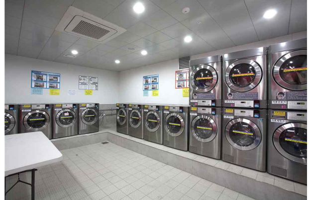
Card operated laundry room